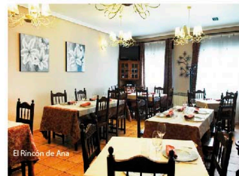
El Rincón de Ana

De nuevo en el coche seguimos las aguas del Pirón en su último tramo por la provincia. En Fuente el Olmo de Íscar los pinares ocupan un lugar destacado para sus habitantes dedicados a la resinación desde hace décadas. Podemos visitar el gran pino de las apuestas o el museo parroquial de la iglesia de San Cristóbal. La carretera se desvía a Villaverde de Íscar , donde los pinos piñoneros relegan a los negrales formando un bosque luminoso de copas aparasoladas. La nave y el ábside de la iglesia de San Sebastián son románicos. Regresamos a Fuente el Olmo y nos dirigimos a Fresneda de Cuéllar siguiendo la estela del río entre las huertas y el pinar. Una vez más cruzamos el Pirón junto al que se levanta el molino de Alvarado. Los pinos piñoneros son más abundantes y su explotación es una de las industrias más importantes del pueblo. En Chañe se encuentran las lagunas de la Redonda y del Santo Cristo, en las que se criaban