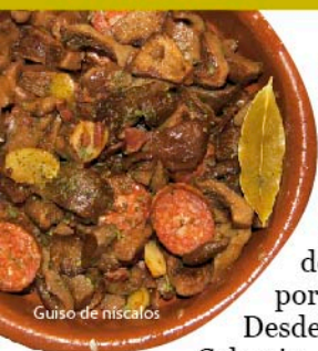
Guiso de niscalos

La segunda jornada la dedicaremos a la comarca del Carracillo que ocupa la zona de transición entre los ríos Eresma y Cega. Desde Carbonero el Mayor tomamos la autovía a Navalmanzano . Entre las casas destaca la torre de pizarra de la iglesia de los Santos Justo y Pastor, rematada por una veleta de un caballo al galope. Desde aquí podemos seguir el camino del Calvario, y tras cruzar Puenteacanto -siglo XVIII- subir hasta la ermita románica de Santa Juliana.