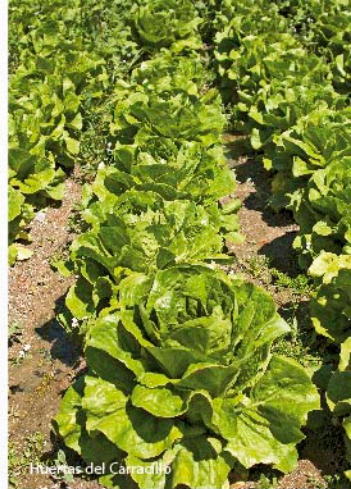
Huertas del Carracillo

Pirón. Primero atravesamos Narros de Cuéllar en el que se encuentra la balsa de la recarga artificial del acuífero que abastece los pozos de la huerta del Carracillo. Ya sólo quedan unos kilómetros hasta Samboal , donde terminaremos esta jornada no sin antes disfrutar de su magnífica iglesia de San Baudilio, un impresionante templo del románico de ladrillo comparable con la iglesia de San Andrés de Cuéllar. Su origen se relaciona con el desaparecido priorato benedictino de San Boal de Carracielo del Pinar fundado en el siglo XII.