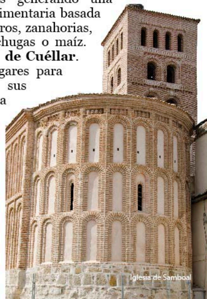
Iglesia de Samboal

La carretera llega a Chatún , ya en el corazón del Carracillo. Las arenas de la tierra de pinares se han convertido en productivas huertas generando una potente industria agroalimentaria basada en productos como puerros, zanahorias, remolachas, patatas, lechugas o maíz. Seguimos hasta Campo de Cuéllar . Uno de los mejores lugares para observar el pueblo y sus alrededores es la ermita de san Mamés, de la que queda en pie el ábside románico. Las lagunas de las Adoberas y Herrera se integran en el casco urbano presidido por la iglesia de san Juan Bautista en la que destaca el artesonado mudéjar. Nos desviamos a la izquierda en busca del valle del