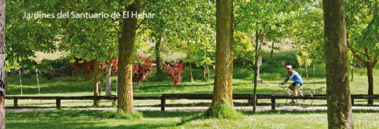
Jardines del Santuario de El Henar