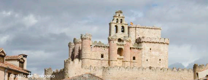
Castillo de Turégano

Mayor. En su interior alberga la iglesia de San Miguel sobre la que se adosaron muros y contrafuertes, siguiendo los deseos del Obispo Arias Dávila, personaje muy vinculado a la Corte del siglo XV. (concertar visita en el Tel: 921 500 500). En la iglesia parroquial de Santiago se ha restaurado un magnífico relieve románico que bien merece una visita. En cualquiera de sus restaurantes se puede comer lechazo asado y el tradicional bacalao al ajo arriero. Pero si queremos caminar o adentrarnos por el piedemonte a través de sus barrios tenemos varios recorridos, ya sea en bicicleta o andando (más información sobre su naturaleza y patrimonio en acotur.es). Junto a las piscinas municipales comienza la Senda de la Casa del Ingeniero , un interesante recorrido a través de la gestión forestal que ha permitido conservar estos bosques de forma sostenible. La antigua casa del ingeniero jefe que ordenó este pinar es ahora un museo sobre la gestión forestal.