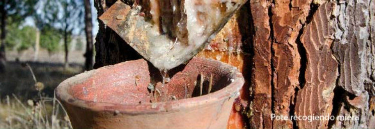
Pote recogiendo miera