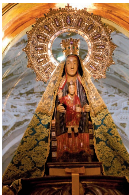
Suplemento sobre el Año Jubilar en El Henar